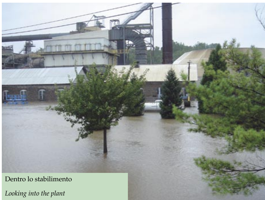
Dentro lo stabilimento

The Bushkill Creek has breached the quarry berm and destroyed a dam constructed the previous year.