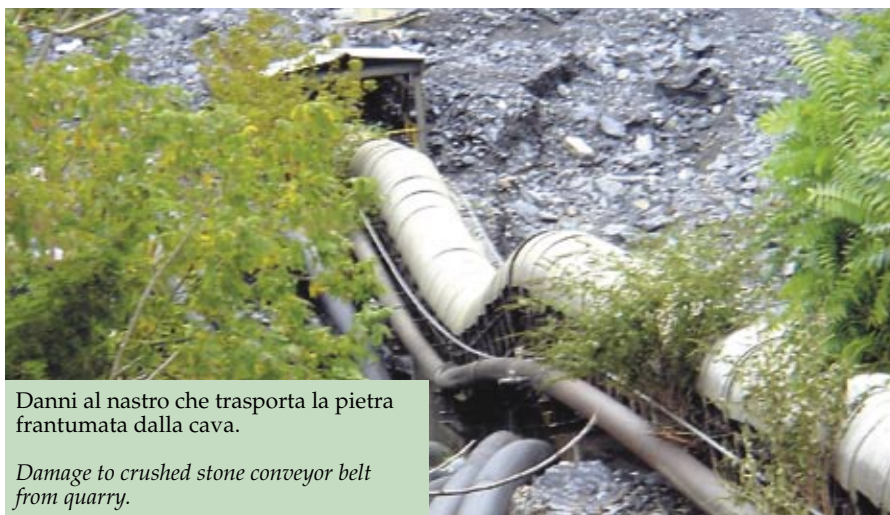
Danni al nastro che trasporta la pietra frantumata dalla cava. Damage to crushed stone conveyor belt from quarry.