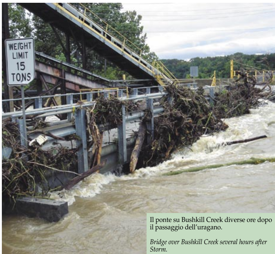
Il ponte su Bushkill Creek diverse ore dopo il passaggio dell'uragano.

On the morning of September 18, 2004, after Hurricane Ivan dropped 4.50 inches (116.6 mm.) of rain, in a few hours and Bushkill Creek that flows through the Stockertown Plant overflowed its banks. The water came up so fast that the plant was unprepared to cope and shutdown of the equipment was started.