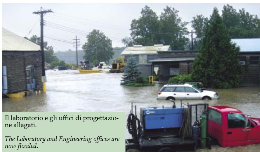
Il laboratorio e gli uffici di progettazione allagati.

The Laboratory and Engineering offices are now flooded.