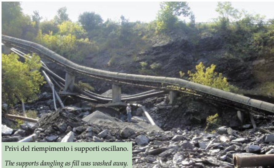
Privi del riempimento i supporti oscillano. The supports dangling as fill was washed away.

belt to collapse. Also, all of the piping used to convey the water being pumped from the quarry was badly damaged preventing any pumping once power was restored until the damage could be repaired. This quarry has a major water problem anyway and upwards of 60,000,000 gallons of water per day is pumped. The water started to recede from the plant within a few hours and efforts commenced immediately to get power restored. By 6:00 PM that day an outside electrical contractor was in the plant with men and equipment to start the restoring effort. All underground conduits were flooded and all manholes had to be pumped out. Then, all wiring had to be tested before power could be established. The quarry was a major concern as pumping could not be started until the piping was repaired and the water level was rising. Primary pumping is done with 4 vertical turbine pumps and it was discovered that they had become buried in mud from the creek washing into the quarry. Many portable diesel pumps were brought in, the pipes repaired, and pumping re-established. It was estimated that upwards of 600,000,000 gallons of water needed to be pumped out of the quarry! This was in addition to the normal pumping required. It required over 3 months to pump out the quarry. It is difficult to describe the work necessary to restore the plant. The water and mud penetrated several MCC's and they had to be cleaned, be dried out and tested. Over 200 motors had to be pulled and sent out for drying and testing.