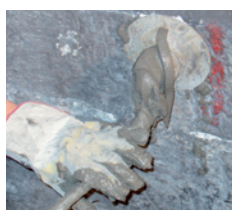
Fase di iniezione della malta Eco T 55