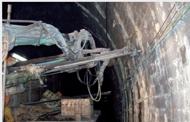
Fase di perforazione

Nota: Le prescrizioni sopra riportate, frutto della nostra migliore esperienza, sono da ritenersi del tutto indicative. Non si assumono responsabilità per difetti o danni causati dall'utilizzo improprio del prodotto e quando le condizioni di impiego non corrispondono alle nostre indicazioni. Il Servizio Assistenza Tecnica è a completa disposizione per consigli inerenti il corretto uso del prodotto e per l'esecuzione delle prove tecniche.