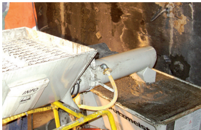
Miscelazione della malta Eco T 55

Il prodotto è idoneo anche per il riempimento in calotta tramite foro trivellato.